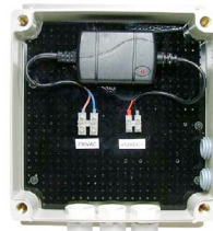
Art.Nr. 14357 mit 12V DC / 1A Netzteil