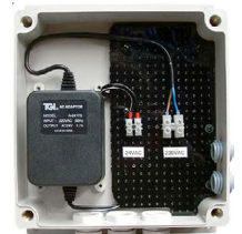
Art.Nr. 14349 mit 24V AC / 1,7A Netzteil